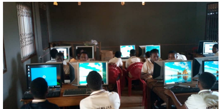
Computerkabinett mit 25 Sätze Mini-PCs und Zubehör für die „Amofo Junior High-School“ in Amofo