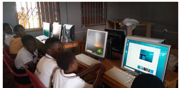
Auch durch Zuschauen werden Kenntnisse gewonnen.