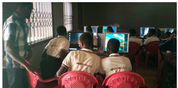
Schülerinnen und Schüler sind aufmerksam beim ersten PC-Kurs. Der IT-Lehrer ist im Einsatz. Alles läuft tadellos.