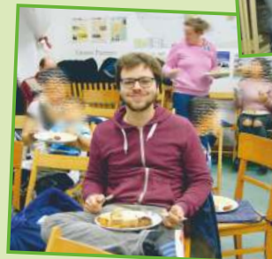
Während einer Seminar-Pause nach intensiven Büroarbeiten