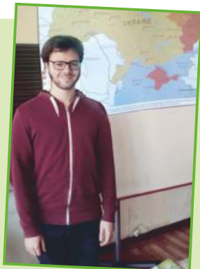
Vortrag in einer Grundschule über die Not in der Ukraine

Damit wir regelmäßig interessante Freizeitangebote im Bereich der Kinder- und Jugendarbeit schaffen können, benötigen wir auch hier Ihre finanzielle Mithilfe.