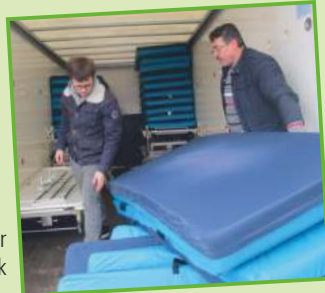
Beladung eines Hilfstransports für die Flüchtlingslager im Nordirak