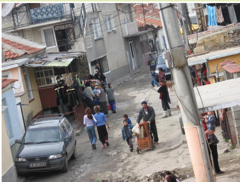
Ghettoalltag in Vladislowowo