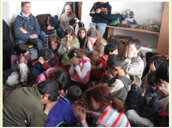
Kinder beim Beten